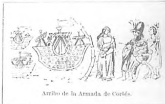
Arribo de la Armada de Cortés.

Parece conservar la majestad de corte, la severidad que un pasado aristócrata le infundiera.