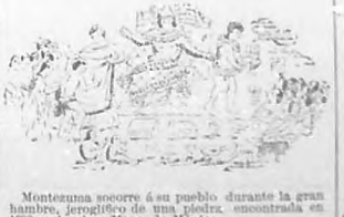
Montezuma socorre á su pueblo durante la gran hambre, jeroglífico de una piedra, encontrada en 1790 en la plaza Mayor de México.