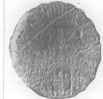
Gran piedra que se conserva en el Museo Nacional de México que representa el Dios Tzontémoc.

Luz eléctrica ilumina la población en sus avenidas más espléndidas, alguna tan importante como la calzada de la Reforma, de cua-