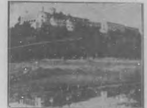
Castillo de Chapultepec. Edificado sobre las ruinas del Palacio de Montezuma, residencia viceroyal del Presidente Díaz.