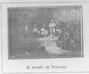
El Senado de Tlaxcala

fondo y en la forma democrata, liberal, marchando paralelamente con el progreso de los tiempos. A él debe la nación cuanto es y cuanto vale. A él, que lleva lustros en el poder ni más ni menos que uno de los emperadores que fueron.