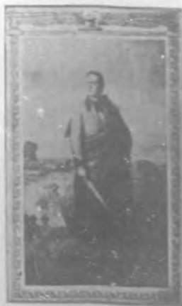
General Francisco Javier Mina