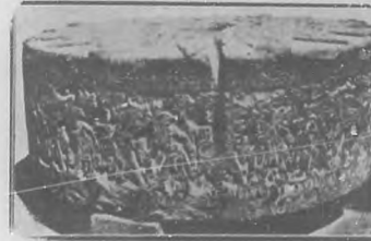
Piedra del sacrificio que se conserva en el Museo Nacional de México. En el centro de la piedra hay una abertura redonda donde se colocaba el corazón palpitante de los sacrificados.