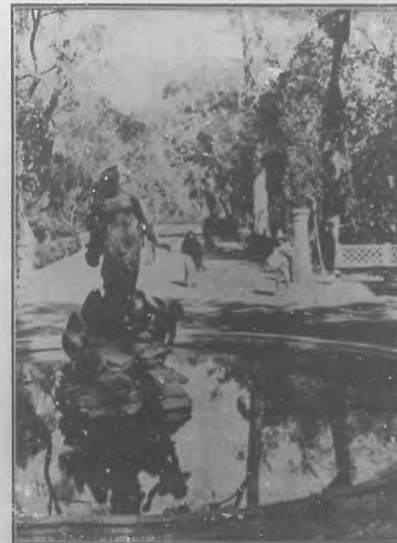
Vista del bullio parque "La Armada".