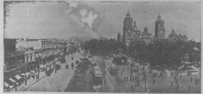
La Catedral y la Plaza de la Constitución.