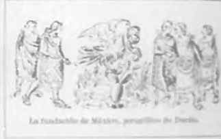
La fundación de México, un poblillo de Durrin.

gran imperio y hoy es no menos grande y próspera república, concentrándonos en México, en el México moderno, parece como que echemos de menos el pasado del que quedan vestigios sabiamente conservados, en pro de una tradición gloriosa, en ciertos edificios modernizados, como el país.