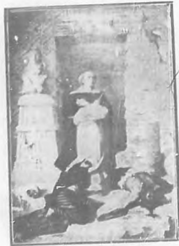
Fray Bartolomé de las Casas, Obispo de Chiapas. "El Defensor de los Judíos."