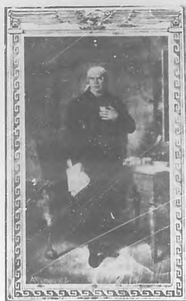
José María Morelos

El pueblo de Dolores será siempre la cuna de la independencia del pueblo