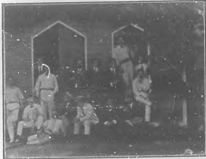
Primitiva casa del "Vedado Tennis Club".