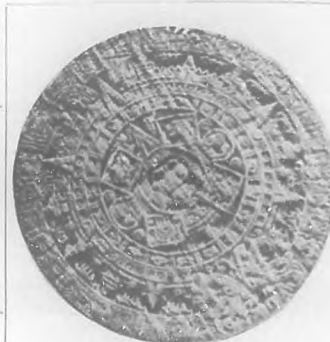
Gran piedra con el nombre de "Calendario Azteca", que se conserva en el Museo Nacional de México.