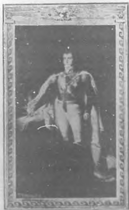
Agustín de Iturbide

Y porque no voyas, lector piadoso á tildarme de maldiciente, quiero recordarte que el copioso arsenal de las Cartas de Indias atestigua, con testimonio irrefutable el espionaje por mí en el párrafo precedente denunciado, y no he de omitir, como dato elocvente, por lo que á la separación de clases y provincias atañe, que el Conde de Floridablanca fué acusado de inno-