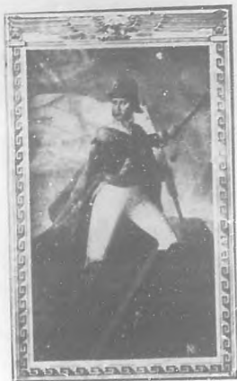
General Mariano Matamoros

dor peligroso y perjudicial al Estado, cuando, en tiempos relativamente próximos á nosotros, estableció la unión postal entre Buenos Aires y la Nueva California. A la tupidia red de aquel incesante ojo, no logró escapar ni la lealtad acrisolada y la épica grandeza de Hernán Cortés, de quien llegó á afirmar Rodrigo de Albornoz, su mortal enemigo, que trataba de alzarse con la tierra, erigiéndose en soberano del imperio azteca, no sin que encontrara aquella descomunal falsedad oídos solfeitos en la corte, que prestamente, tras de nombrar audiencia para Nueva España, presidida por Nuño de Guzmán el feroz despoblador de Pánuco, hizo emprender viaje á la Península al vencedor de Otumba.