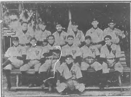
Novena triunfadora del "Vedado Tennis B. B. Club".