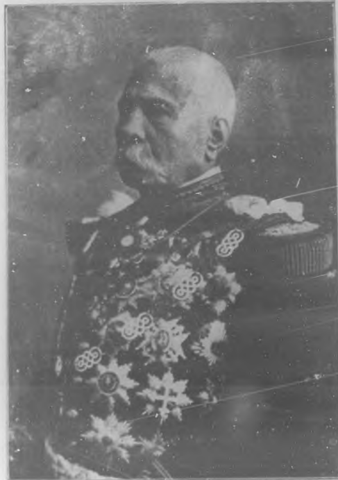
General de División D. Porfirio Díaz, actual Presidente de México.