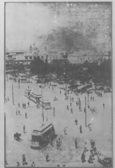
Vista de la Plaza Mayor.