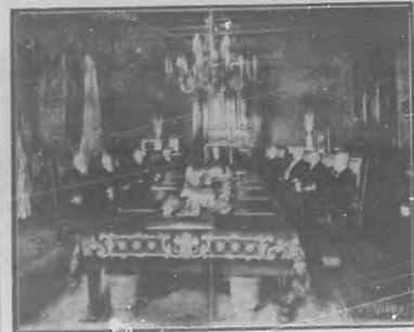
Presidente D. Porfirio Díaz y su gabinete, celebrando un Consejo de Secretarías.