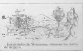
Los criollos de Mexicana observan los barcos de Grijalva.