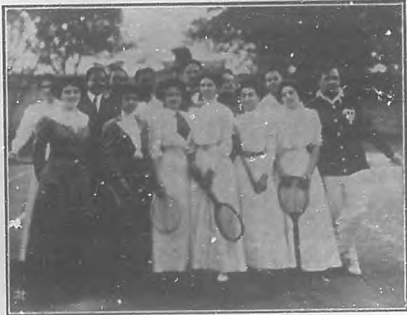
Grupo de señoritas y jóvenes jugadores de "tennis".