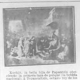
Xochitl, la bella hija de Papantzin ofreciendo la primera taza de pulque (la bebida nacional), á Tepanacaltzin, octavo rey de los Toltecas.