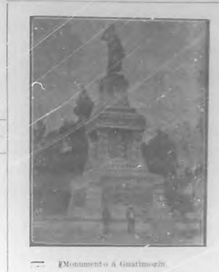
Monumento á Guartelmo