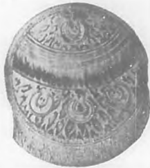
Batalla de guerra de Montezuma dibujo de Cronas, según el original que se conserva en el Museo Nacional de México.

terial, por lo que á la población se refiere, hállase la mezcla de un pasado con un presente opuesto á aquel pero de cuya conjunción surgió una nación pujante, y cada día se acrecenta una ciudad orgullo de la América latina, y espejo en que se miran otras de tierra azteca.