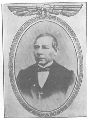
BENITO JUÁREZ Primer Presidente de México

dos esfuerzos, y no obstante las débiles rectificaciones que á veces imponía con lógica incontrastable la realidad, los errores iniciales de la colonización siguieron informando la política de España en sus posesiones del Nuevo Mundo durante los tres siglos posteriores á la conquista, hasta que la deposición de los Borbones por Napoleón y los acaecimientos que á aquel suceso acompañaron, poniendo fuego á los combustibles amontonados por espacio de trescientos años, dieron en tierra con el vetusto imperio colonial.