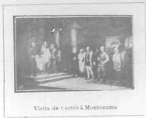
Visita de Cortés á Montezuma