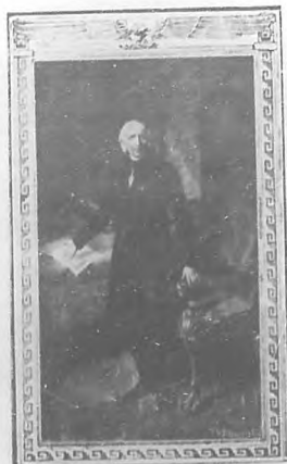
Miguel Hidalgo y Costilla