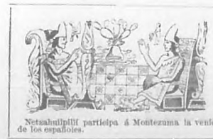
Netzahuilpilli participa á Montezuma la venta de los españoles.

El palacio de un Presidente de República elevado sobre lo que fué palacio de un Emperador. El espíritu de éste animando el de aquel, verdadero emperador, señor y dueño en el